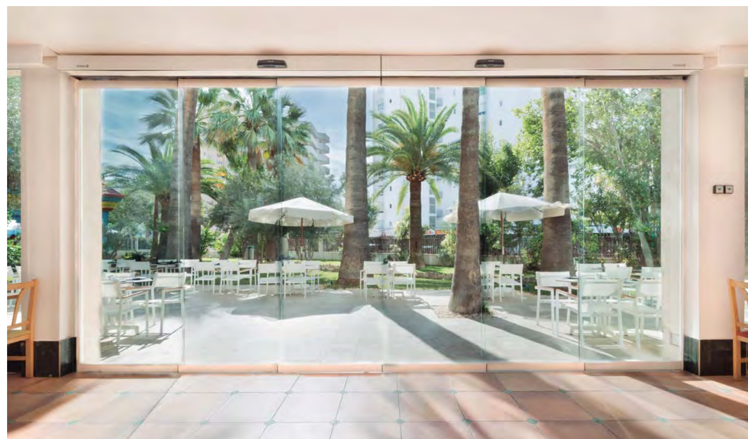
Puertas automáticas de apertura telescópica. Sector hotelero.

Puerta corredera de 2 hojas móviles que se desplazan lateralmente. Las hojas móviles se repliegan unas sobre otras para liberar el máximo espacio de paso en uno de los laterales de la puerta.