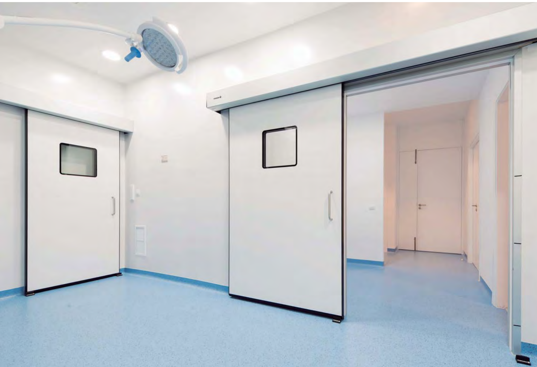
Puertas herméticas correderas. Área quirúrgica hospitalaria.

Las puertas herméticas Manusa aúnan las ventajas de una puerta automática con la hermeticidad e higiene requeridas en ambientes limpios.