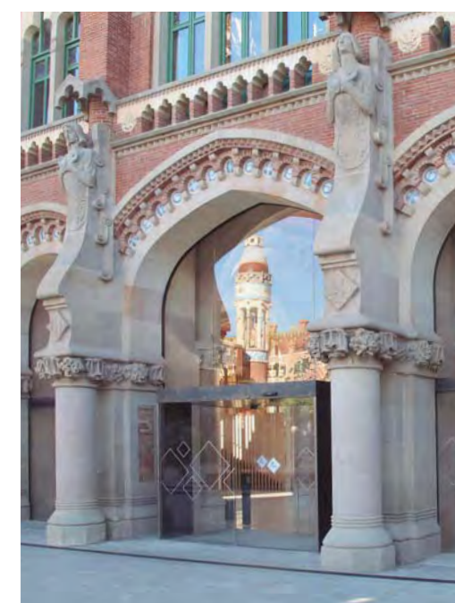
Puerta automática de apertura lateral. Sector museos.