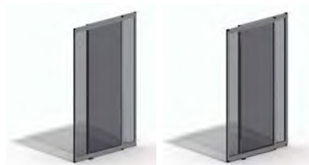
Marco de 20 mm Marco de 30 mm

Aplicable en puertas automáticas correderas de apertura central, lateral, telescópica, curva y semicircular.