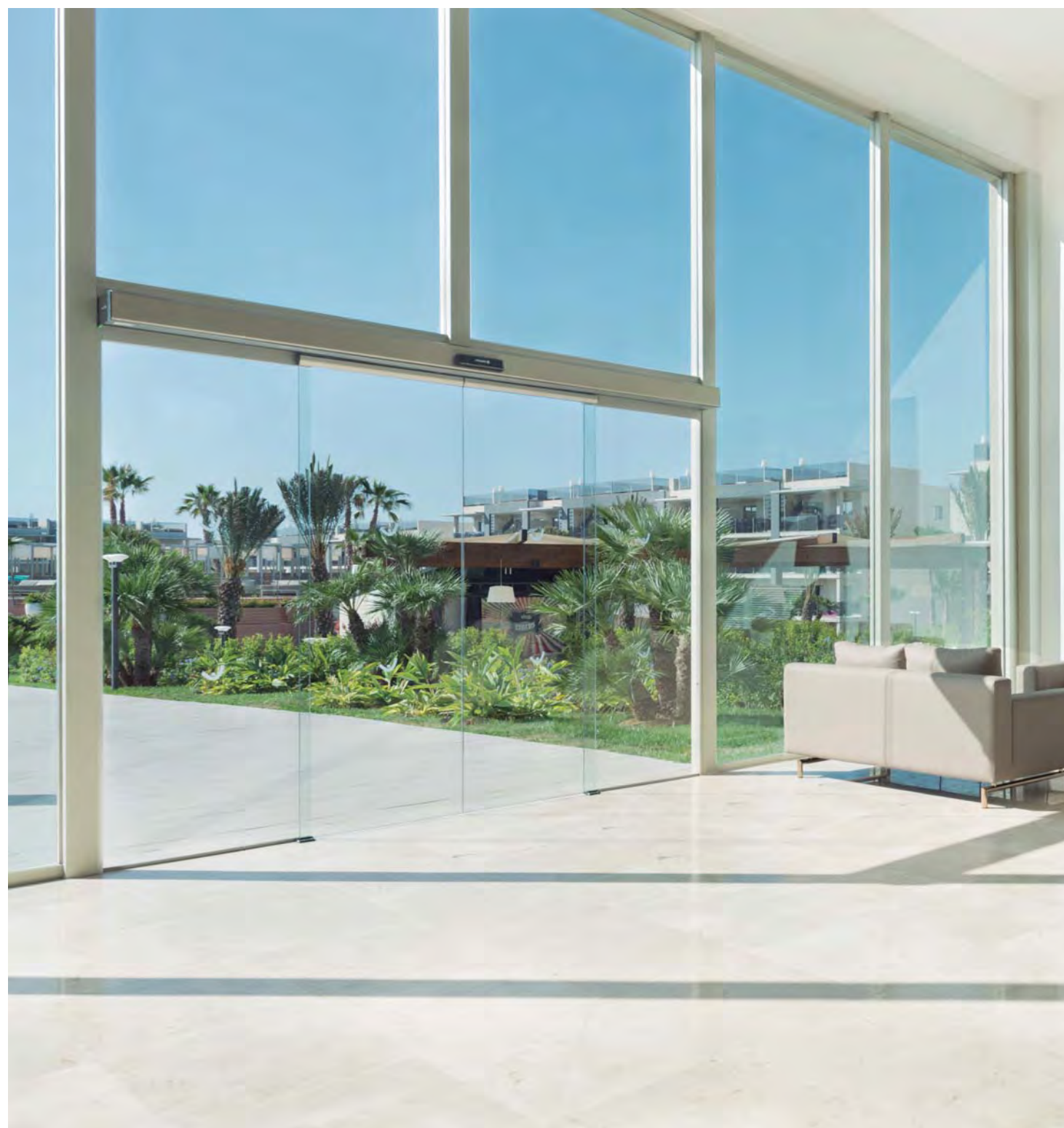
Puerta automática de apertura central. Sector hotelero.

Las puertas correderas centrales y laterales Manusa ofrecen la máxima velocidad de apertura del mercado, junto con la máxima seguridad. Son recomendables en entradas y salidas públicas donde la circulación de personas sea intensa o donde la seguridad de los usuarios esté vinculada a la fluidez del tráfico.