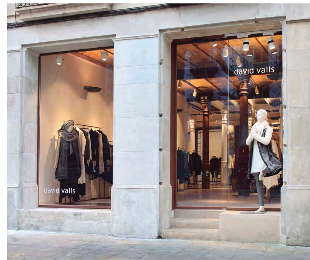
Puerta automática de apertura lateral. Sector comercio.