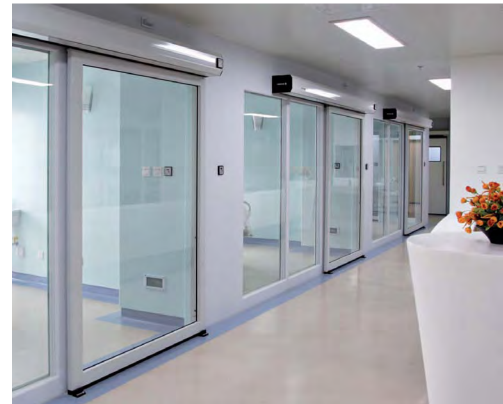
Puertas herméticas acristaladas Clear View. Unidad de vigilancia intensiva hospitalaria.