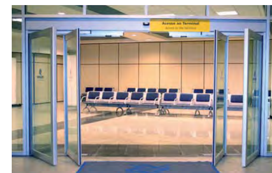
Puerta antipánico con hojas enmarcadas. Sector aeropuertos.

Sistema antipánico con hojas enmarcadas (A45-S4): las hojas correderas y abatibles completamente enmarcadas con carpintería de 45 mm ofrecen gran resistencia y durabilidad, y las hacen aptas para entradas de tráfico intenso.