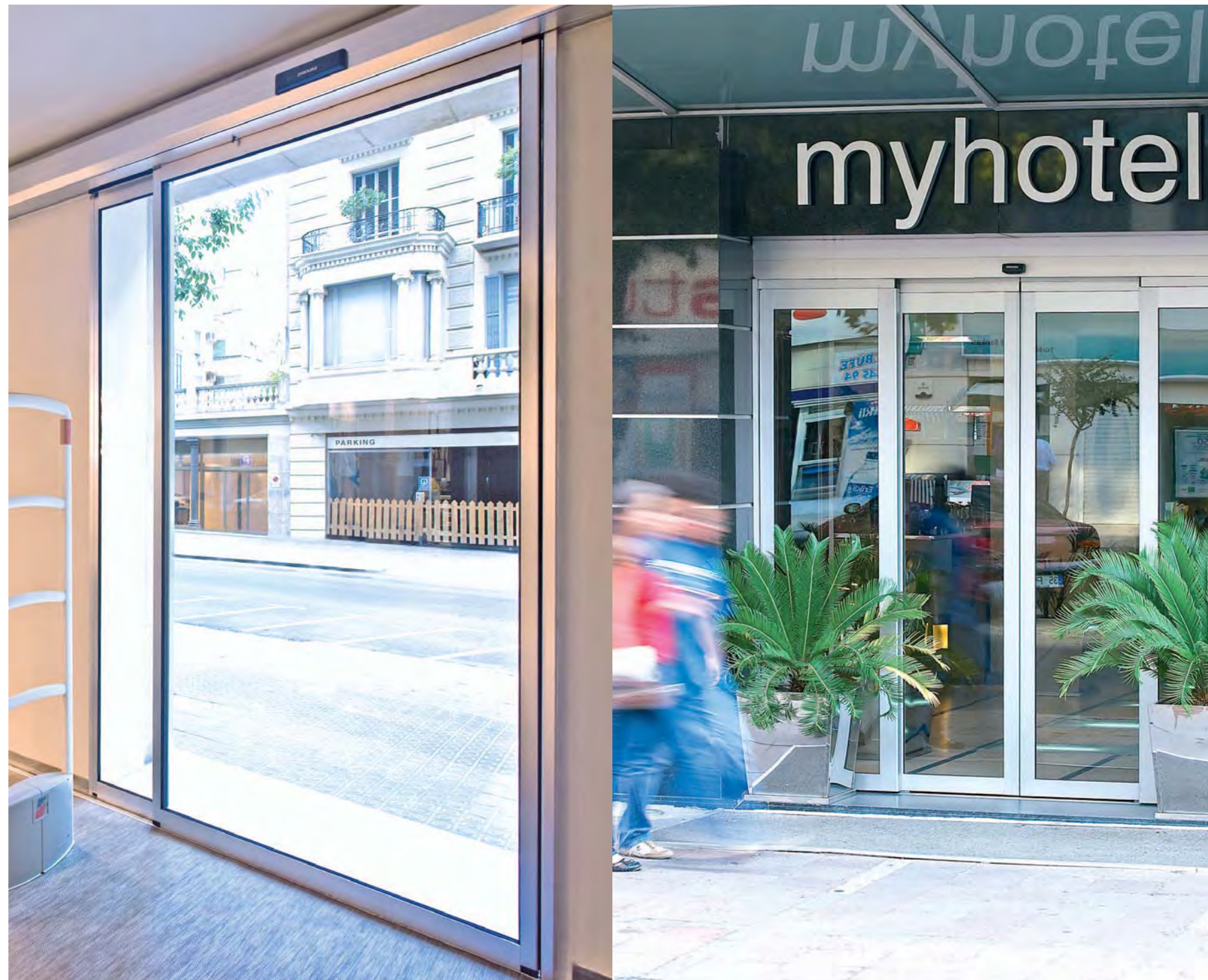
Corredera lateral con hoja enmarcada. Sector comercio.