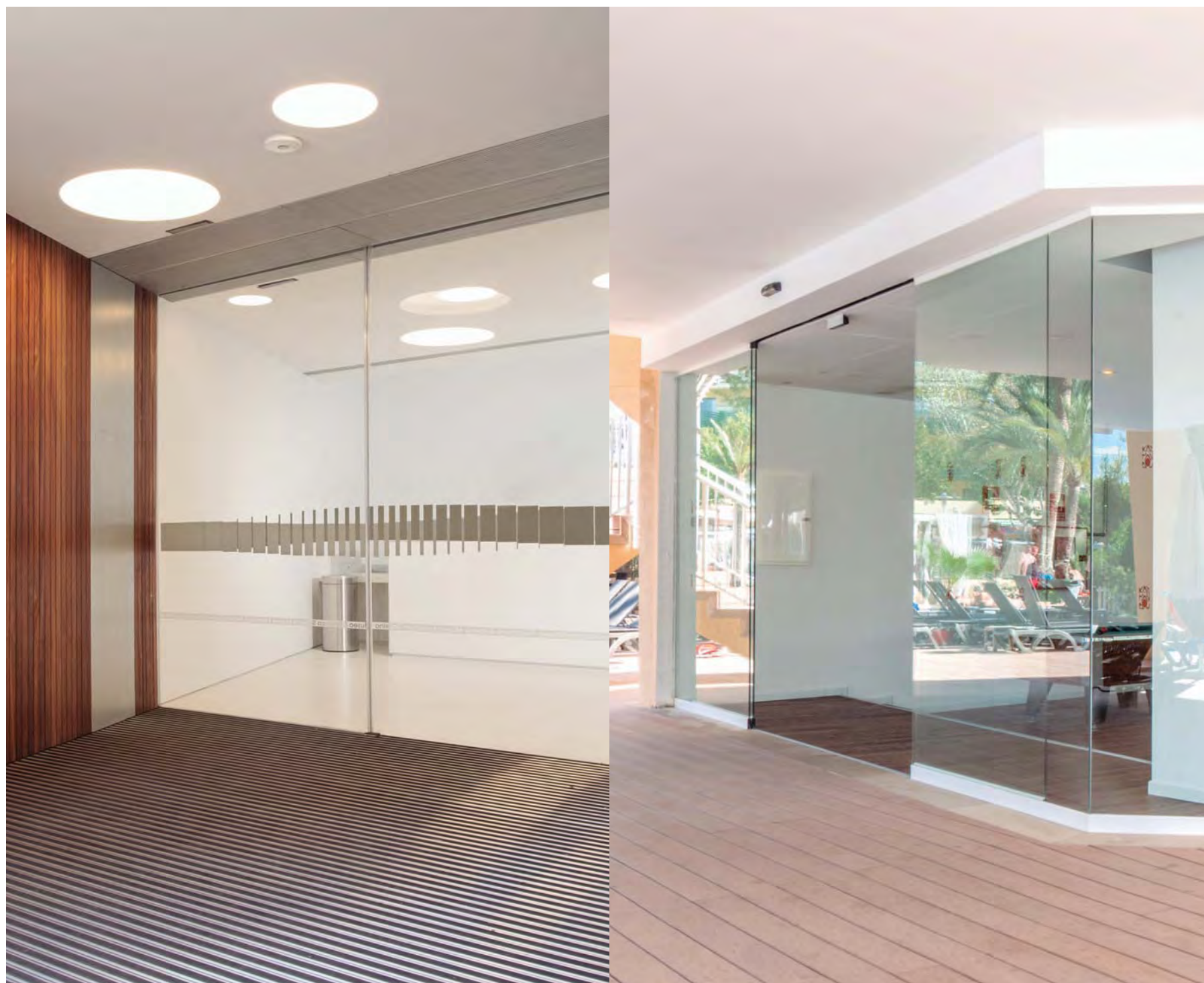
Puerta apertura lateral con hojas totalmente transparentes, opción plinto oculto. Sector museos.