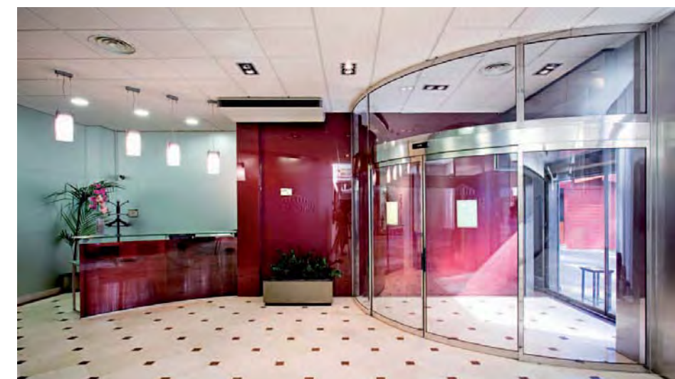
Puerta automática circular. Biblioteca.