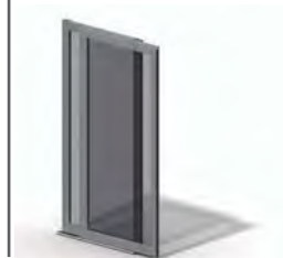
Marco de 45 mm

Aplicable en puertas automáticas correderas de apertura central y lateral.