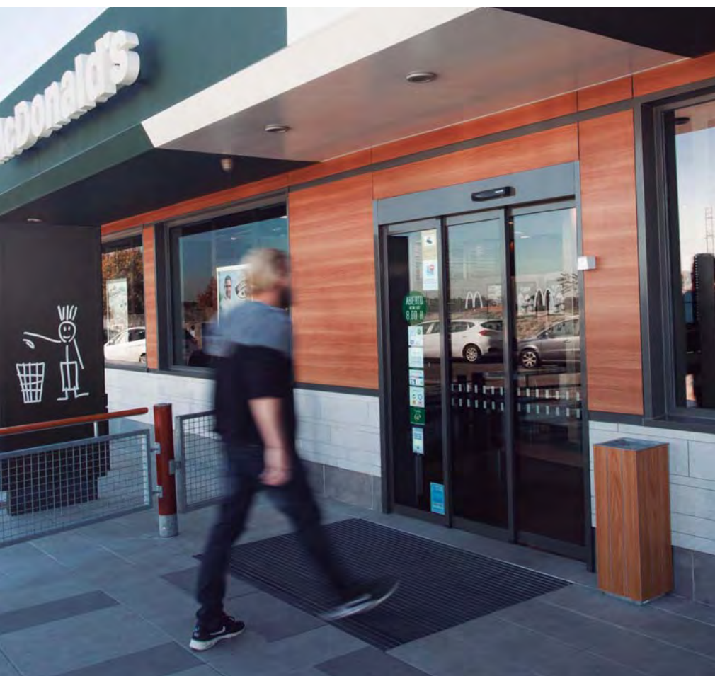
Puertas automáticas de apertura telescópica. Sector restauración.

Son ideales para entradas con limitaciones de espacio, para separaciones de corredores, o donde se requiera una amplitud de paso libre mayor de la habitual, como por ejemplo concesionarios de automóviles.