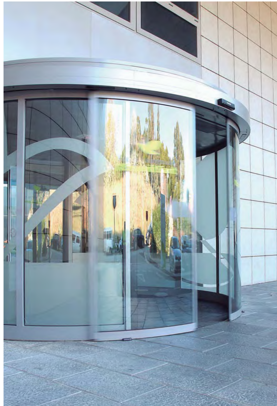
Puerta automática circular. Sector hospitalario.

La puerta puede ser cóncava o convexa y con diferentes radios y grados de curvatura. La combinación de dos puertas curvas permite la creación de puertas circulares, ideales para entradas singulares y funcionales al mismo tiempo.