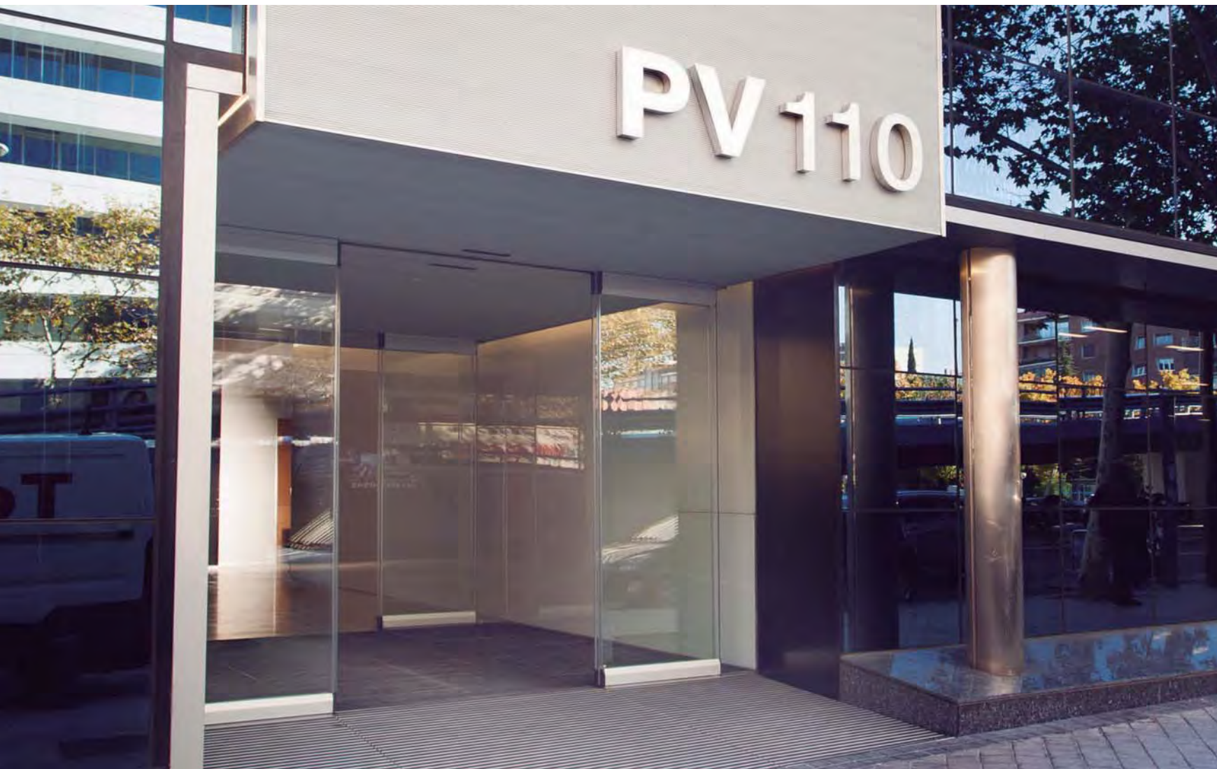
Puerta antipánico con hojas sin perfilera vertical. Edificio oficinas.

Las puertas automáticas con mecanismo antipánico de Manusa combinan la funcionalidad de una puerta corredera con la posibilidad de abatimiento de las hojas, permitiendo así maximizar la zona de paso.